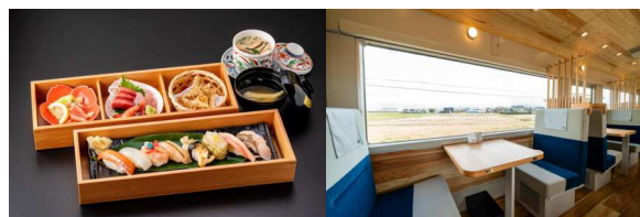
(上) 雪月花の食事と車内(下)一万三千尺物語の食事と車内